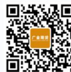
广金期货预约开户码

版权声明：本公众号部分文章推送时，若未能及时与原作者取得联系并涉及版权问题，请及时联系删除。