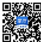
广金期货掌厅APP 期货编号：0108